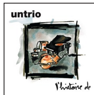
© La lyre et l'aulos - LA01

Riche de son expérience scénique, untrio signe ici un album abouti, où il forge son esthétique, en créant pour ses thèmes des structures harmoniques et rythmiques originales puisant ses sources dans le jazz contemporain. (Compositions signées Renaud Steinhauser et Rafaël Meyrier)